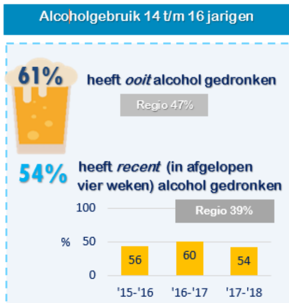
Figuur 2: alcoholgebruik onder jongeren 14 t/m 16 jaar in Asten. Bron: GGD Brabant Zuidoost Monitor 2015-2016 en Vragenlijst klas ¾ (2017-2018)

In onderstaand figuur is het aantal alcoholvergiftigingen dat in 2018 heeft geleid tot een ziekenhuisopname en het aantal Haltstraffen, gerelateerd aan alcoholgebruik weergegeven. De leeftijd van jongeren die een aan alcohol gerelateerde Haltstraf opgelegd kregen in 2016, 2017 en 2018 varieerde van 14 tot 17 jaar.