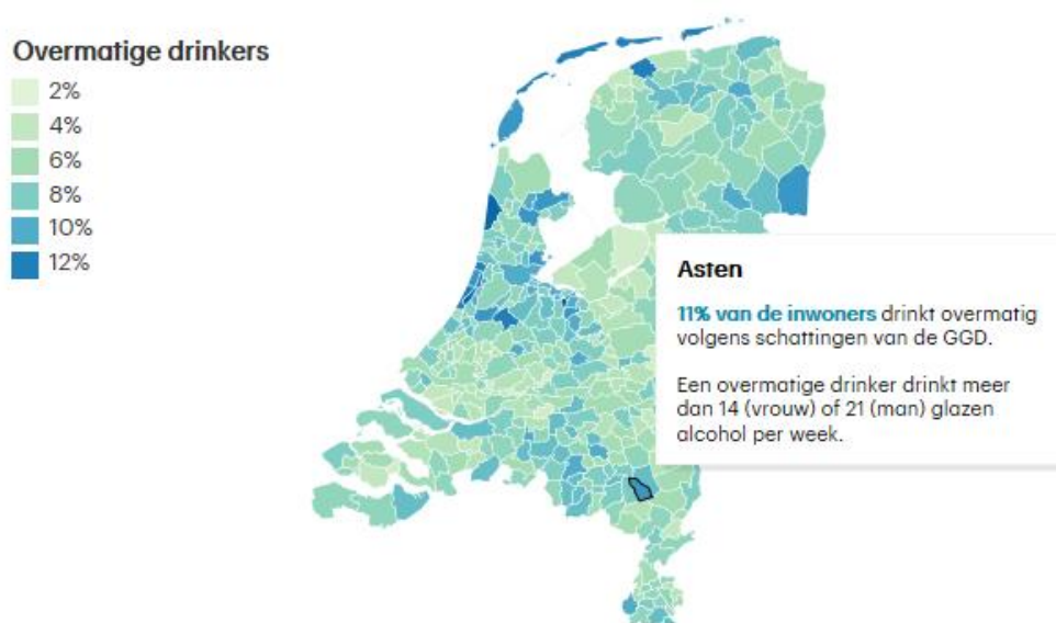
Figuur 1: percentage overmatige drinkers in Nederland.

Het meest recente onderzoek is gedaan in 2015-2016. Hieruit blijkt dat in dat jaar 11% van de Astense inwoners overmatig alcohol gebruikt. Voor vrouwen houdt dit in >14 glazen alcohol per week, voor mannen >21 glazen alcohol per week. Hiermee staat Asten in de regio bovenaan als het gaat om het meeste alcoholgebruik. Ook landelijk scoort Asten hoog (figuur 1).