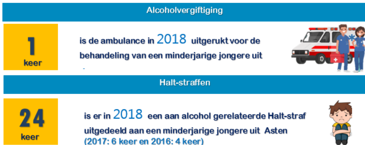
Figuur 3: alcoholvergiftigingen en alcohol gerelateerde Halt straffen

In onderstaand figuur is het aantal alcoholvergiftigingen dat in 2018 heeft geleid tot een ziekenhuisopname en het aantal Haltstraffen, gerelateerd aan alcoholgebruik weergegeven. De leeftijd van jongeren die een aan alcohol gerelateerde Haltstraf opgelegd kregen in 2016, 2017 en 2018 varieerde van 14 tot 17 jaar.